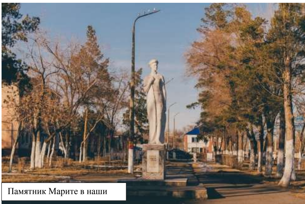
Памятник Марите в наши

Улица имени литовской женщины [Текст] / [ред. газ.] // Кустанайские новости. – 1992. – 18 августа.